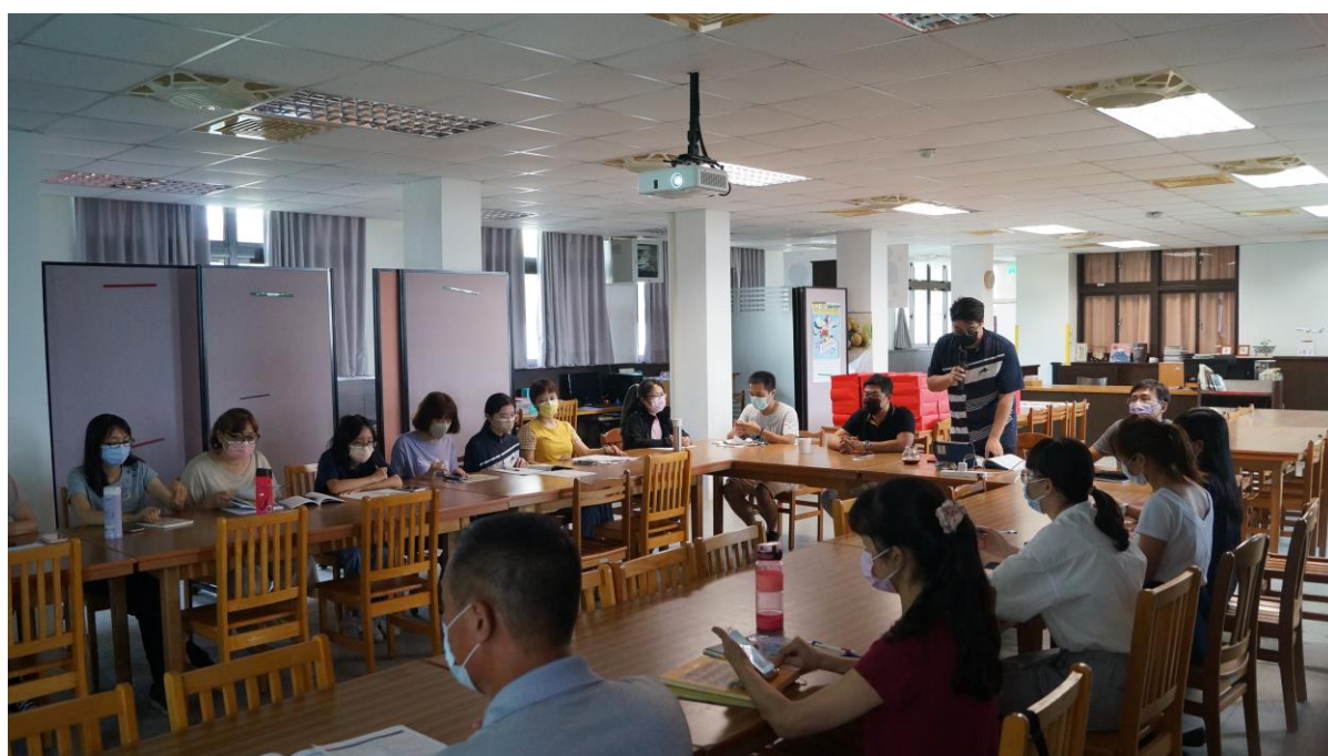
校長說明健康促進執行經費及購置相關設備